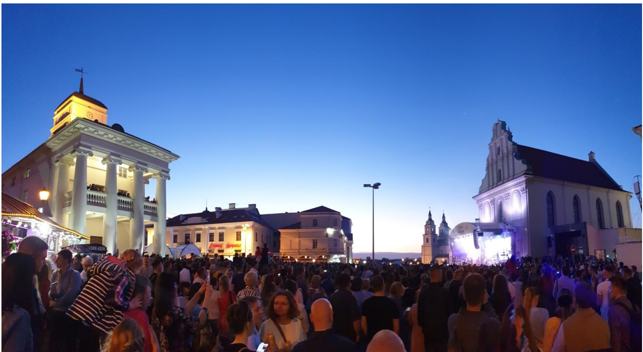
Ратушная площадь г. Минска

МЕЖДУНАРОДНАЯ НАУЧНО-ПРАКТИЧЕСКАЯ КОНФЕРЕНЦИЯ (Минск, 19-20 ноября 2021 года)