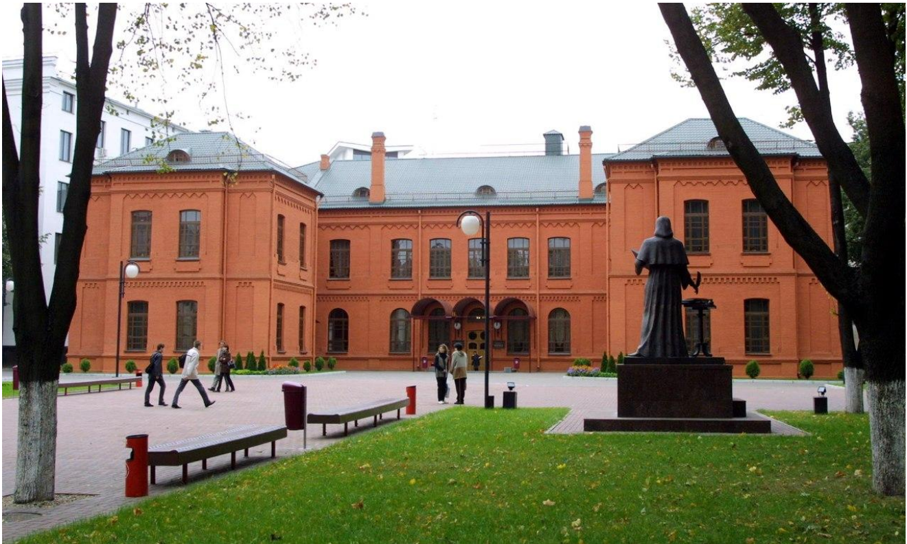
Здание ректората БГУ